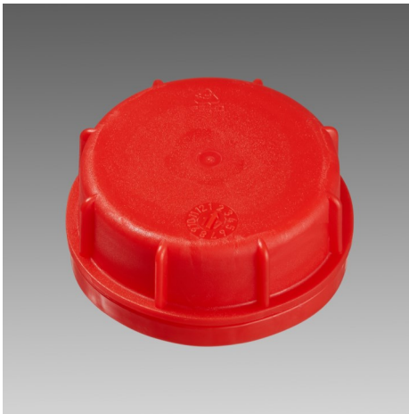
Kanisterverschluss KV51 neutral