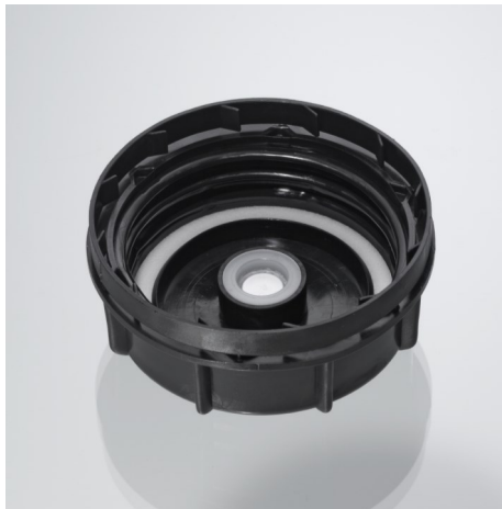
Kanisterverschluss KV51 neutral Mit Entgasung